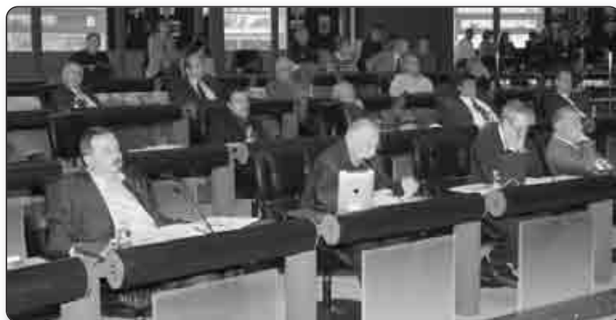
L'assemblée départementale réunie le 13 décembre dans la salle des délibérations