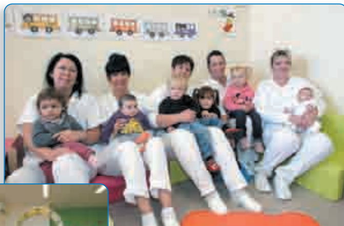
L'équipe des «tatas câlins» et leurs petits pensionnaires

Pour en savoir plus, contacter le 04.95.36.61.68.