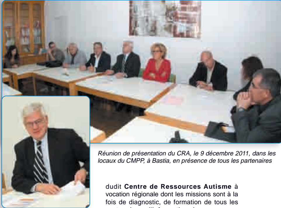
Réunion de présentation du CRA, le 9 décembre 2011, dans les locaux du CMPP, à Bastia, en présence de tous les partenaires

Avec la mise en place d'un Centre régional de Ressources Autisme opérationnel dès mars 2012 et qui, avec ses 250 000 € de budget et se 16 salariés, vient renforcer l'activité d'un IME et d'un SESSAD comptant déjà, à eux deux, 34 places dédiées, l'Agence Régionale de Santé et le réseau de partenaires mobilisés jouent la carte d'une prise en charge globale et in situ de la maladie. Avec, à la clé, une véritable expertise, un diagnostic et un suivi appuyés sur des évaluations personnalisées et pluridisciplinaires de chaque malade et sur des outils validés aux niveaux national et européen. Une initiative attendue par les familles qui sont, elles aussi, via un meilleur accompagnement, au cœur du dispositif.