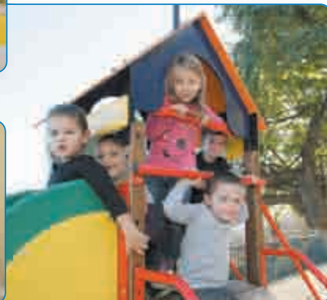
Un jardin d'enfants agrémenta la cour